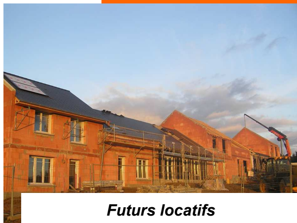
Futurs locatifs Rue des Anciens Combattants

Dès le début janvier, toutes les commissions vont travailler sur la préparation du budget 2015. Nous pouvons affirmer que nous aurons dans les années à venir des budgets très contraints au niveau des recettes du fait de la diminution importante des dotations de l'Etat.