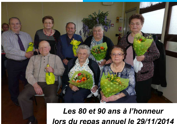
Les 80 et 90 ans à l'honneur lors du repas annuel le 29/11/2014

JEUNES RETRAITES OU NON VENEZ NOUS REJOINDRE PLUS NOUS AURONS D'ADHERENTS, PLUS IL SERA FACILE DE DEVELOPPER DES ACTIVITES